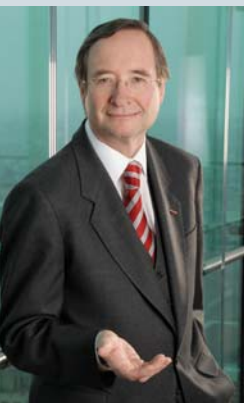
Dr. Christoph Leitl Präsident der WKO